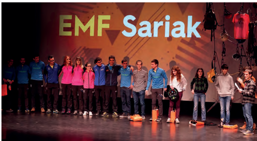
Mendi lasterketako rankingeko irabasleak

PREMIO "SHEBE PEÑA" DE MARCHAS LARGO RECORRIDO / IRAUPEN LUZEKO IBILALDIEN "SHEBE PEÑA" SARIA