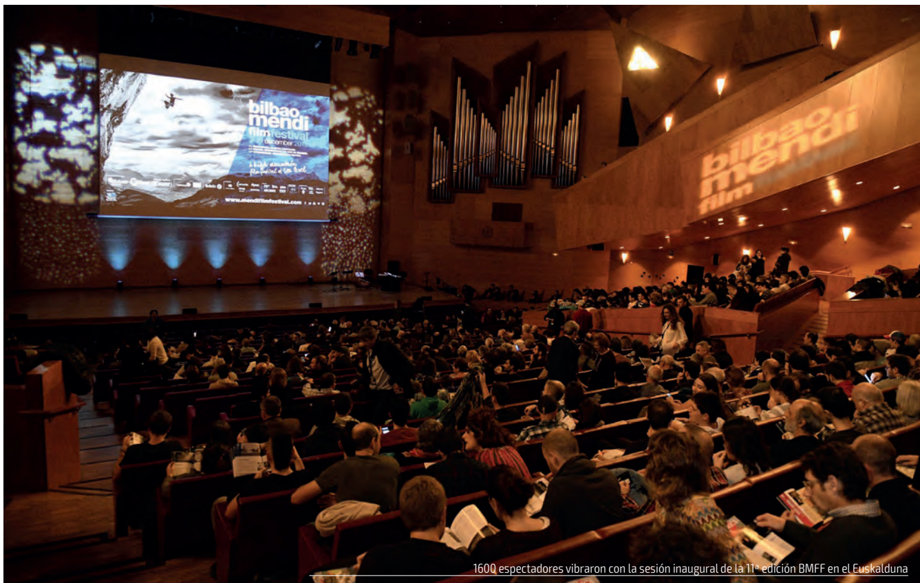
1600 espectadores vibraron con la sesión inaugural de la 11ª edición BMFF en el Euskalduna

“The Dawn Wall”, “Free Solo” eta “Becoming Who I Was” izan ziren Mendi Film Festivalen 11. edizioko pelikula izarrak