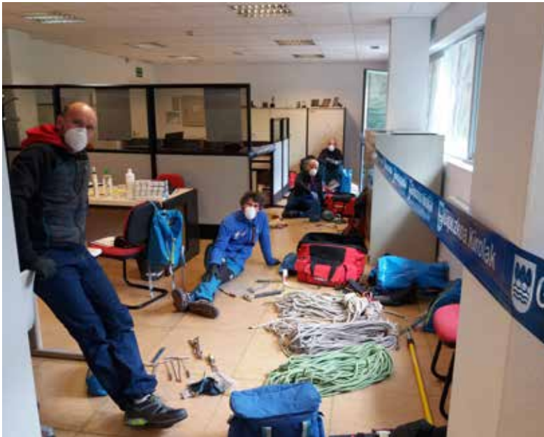
Planificando los trabajos de mantenimiento de zonas de escalada en la sede GMF

Mucho ánimo a todos y a todas. Saldremos de esta unidos. Elkarrekin aterako gera. Zaindu zaitetzte!!!